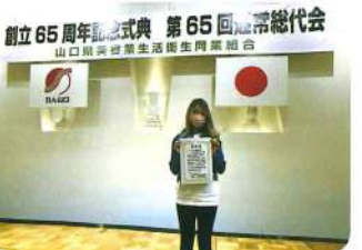
永年勤続従業員表彰